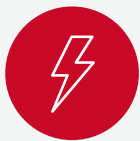
En conflicto/ desastre

Las siguientes herramientas son para que los padres, cuidadores o amigos de confianza las implementen con los niños en diversos entornos. Los siguientes símbolos señalan si la herramienta es para uso con niños en zonas de conflicto/desastre, niños en condición de desplazado o aquellos que están establecidos.